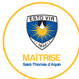
Septembre 2021 Ouverture de la Pré-Maîtrise et du Choeur d'Adultes