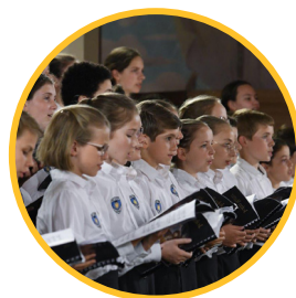
Juin 2019 Concert avec John Rutter pour la première fois à Lyon