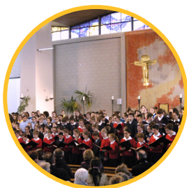
Avril 2016 Congrès régional des Pueri Cantores au Puy-en-Velay