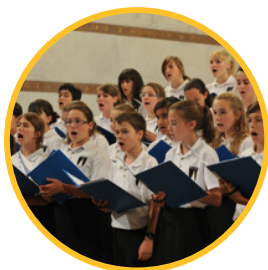
Juin 2015 Congrès régional des Pueri Cantores à Fourvière