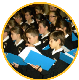
Décembre 2008 Premier concert de Noël