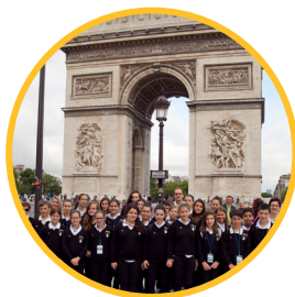
Juillet 2014 Congrès international des Pueri Cantores à Paris