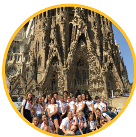
Juillet 2018 Congrès international des Pueri Cantores à Barcelone