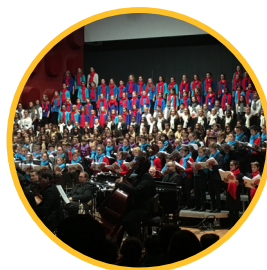
Octobre 2016 Congrès national des Pueri Cantores à Strasbourg